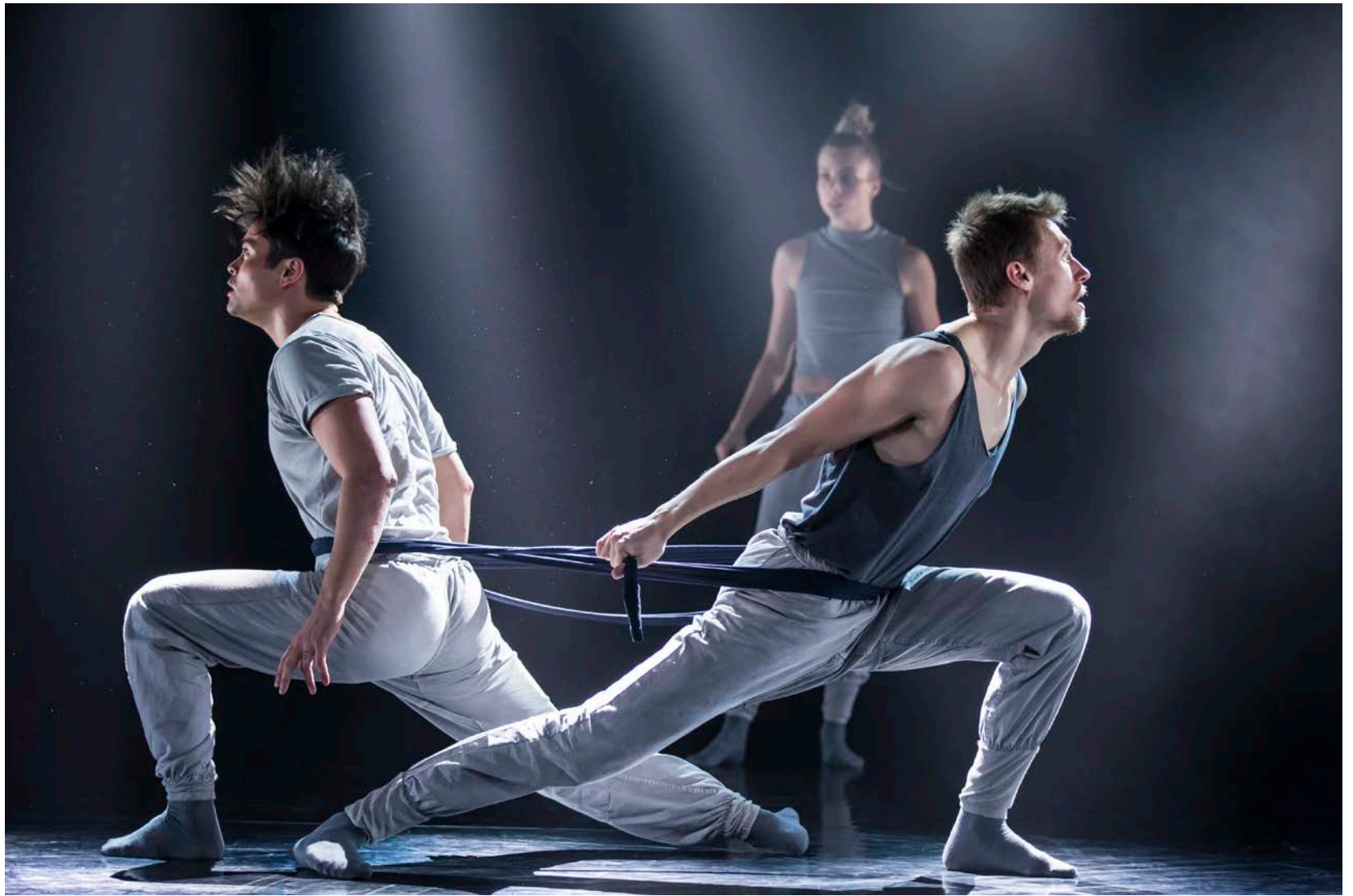
Forestillingen 360° – Den sorteste hvide løgn med Uppercut Danseteater.