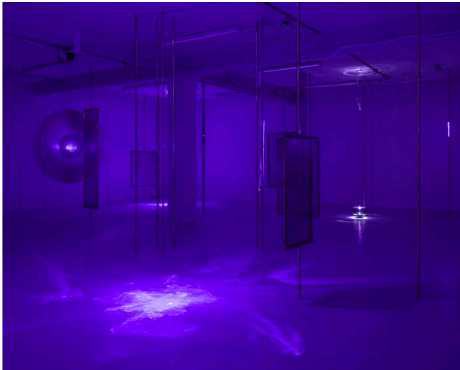
Astrid Myntekær: Orgone . Overgaden, København 2014.