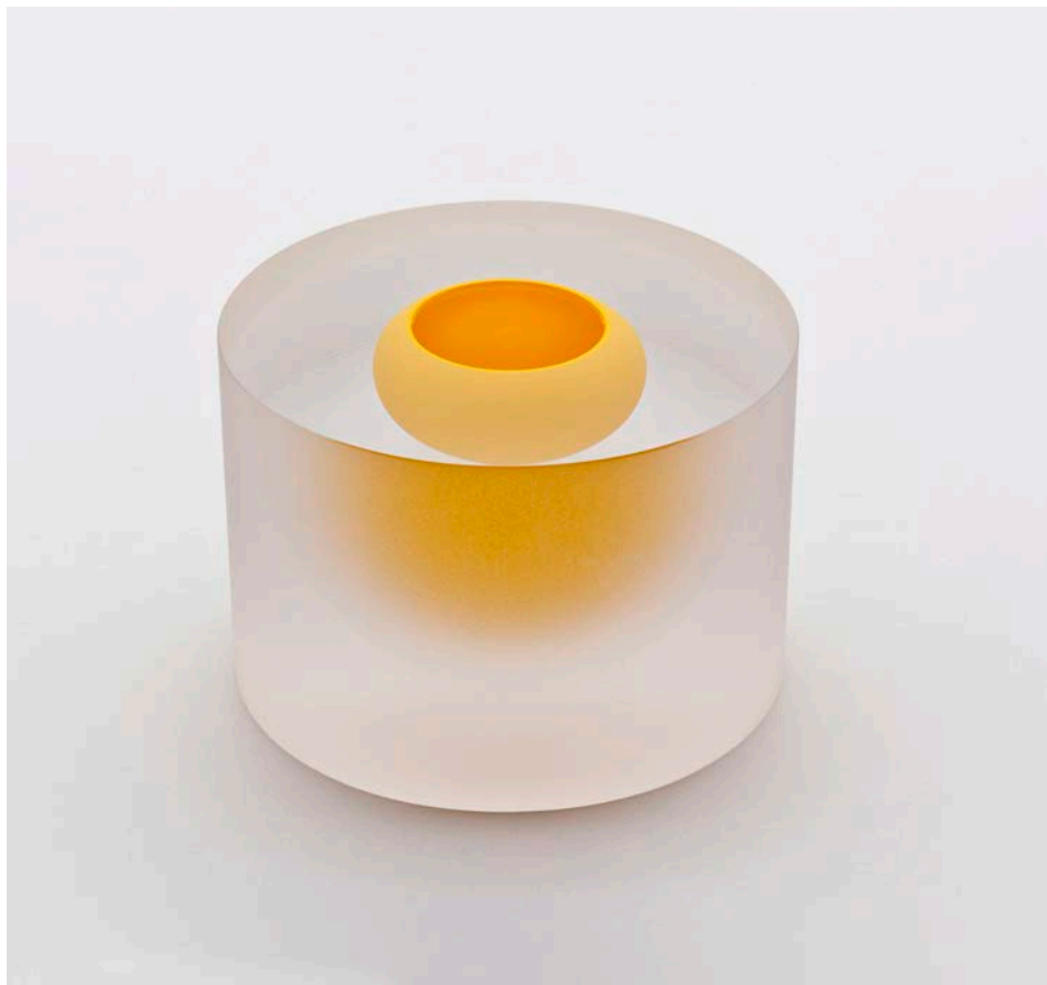
»Cylinder med flydende solgul skål« af Tora Urup, glas, 2014. Indkøbt af Legatudvalget for Kunsthåndværk og Design til Statens Kunstfonds Udlånsordning.

Afro-bafro plakater af Leo Scherfig, trykt i januar 2014. Portrætplakater med to etiopiske musikere, hvor nutidigt fladtryk og gammeldags bogtryk forenes. Leo Scherfig modtog i 2014 et treårigt arbejdsstipendium fra Legatudvalget for Kunsthåndværk og Design.