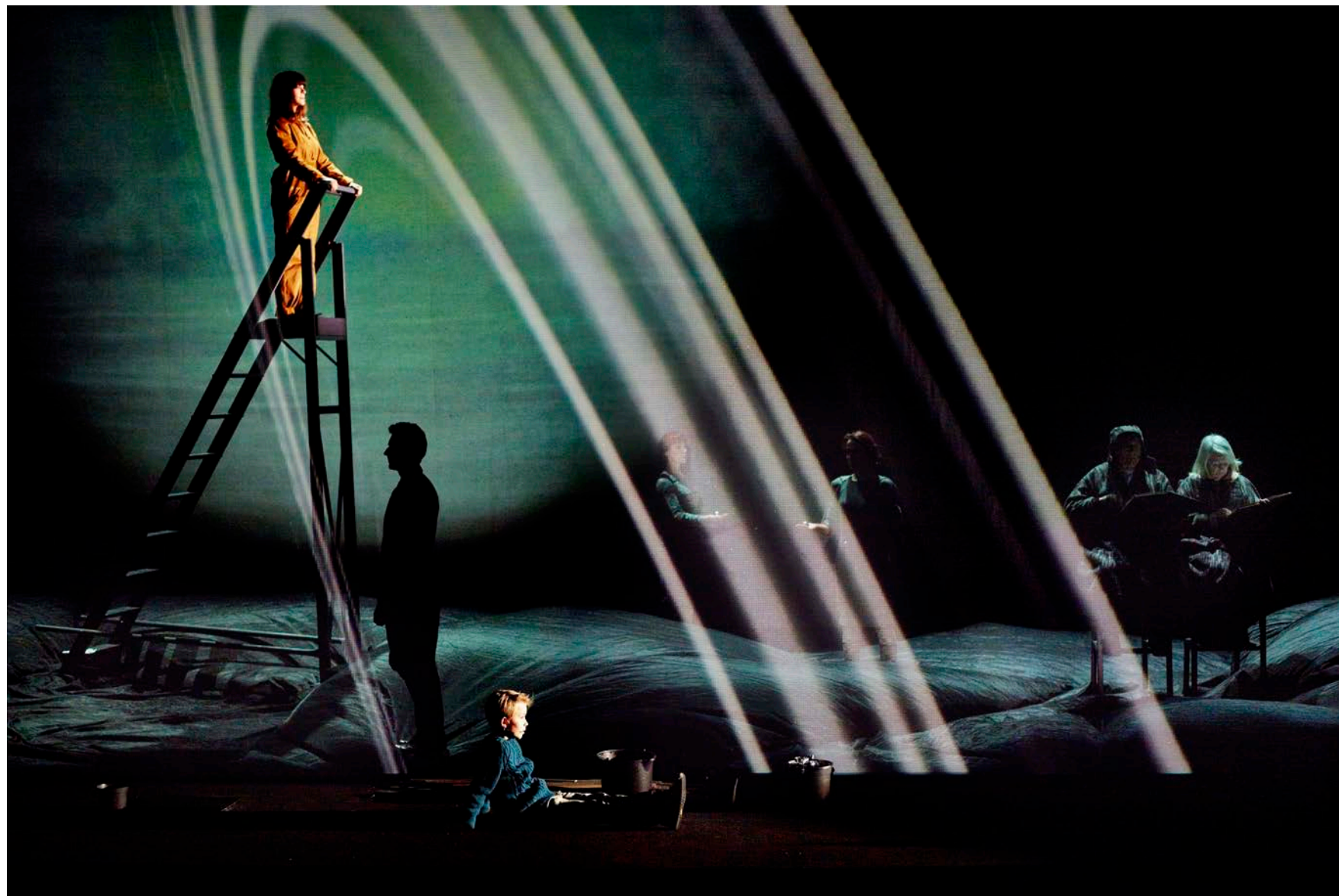
Forestillingen KOSMOS+ med Hotel Pro Forma.