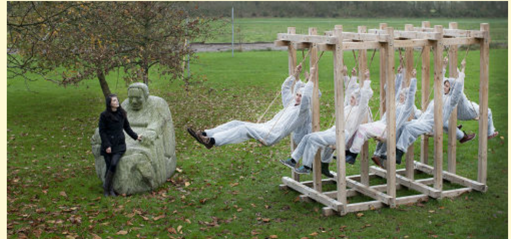
Billeder fra Molly Haslunds performance i og omkring Ringkøbing i forbindelse med Statens Kunstfonds 50-års jubilæum.