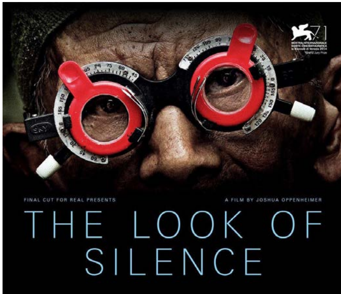
Joshua Oppenheimers dokumentarfilm The Look of Silence blev præmieret af Statens Kunstfond i 2014.