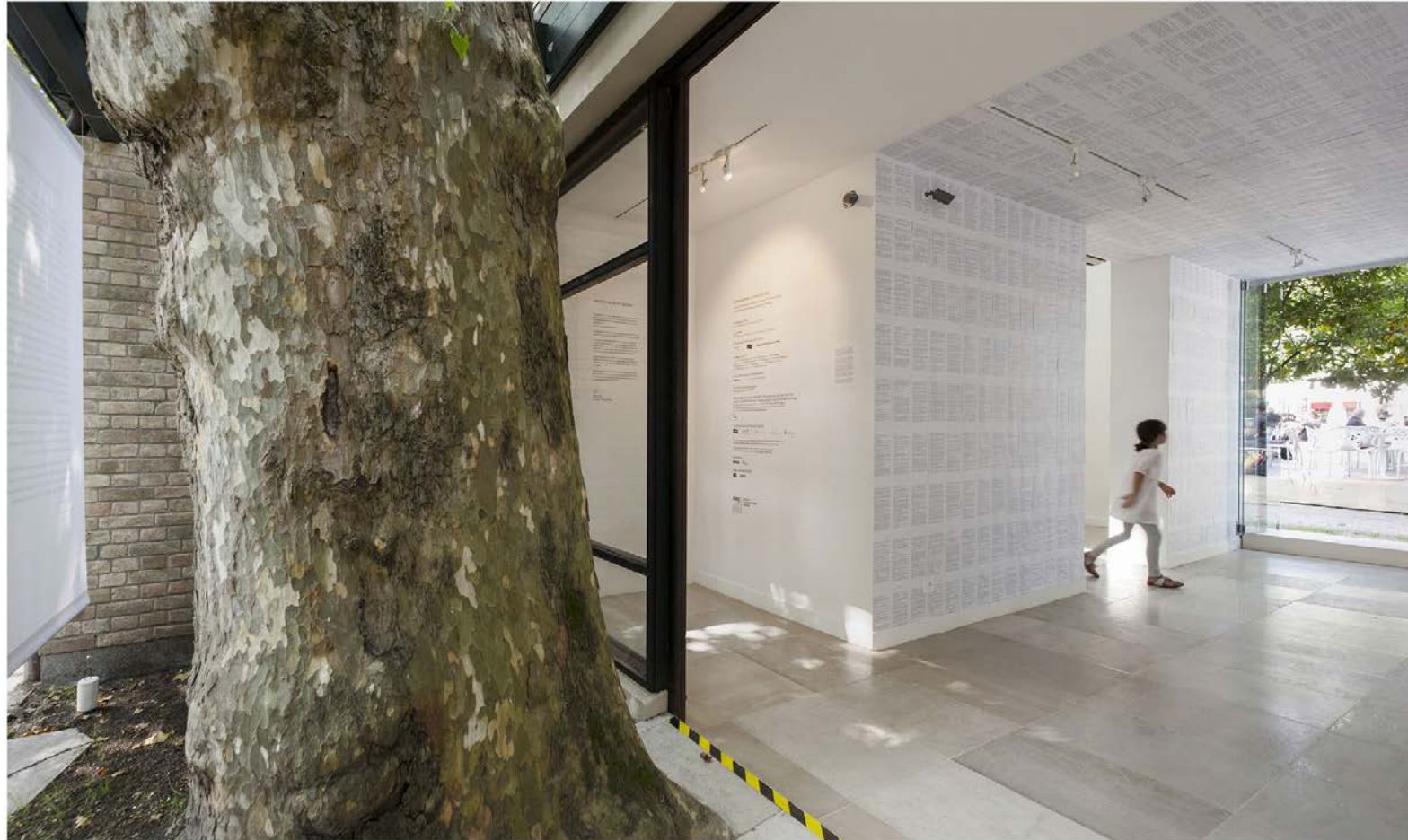
Den danske pavillon på Arkitekturbiennalen i Venedig 2014.