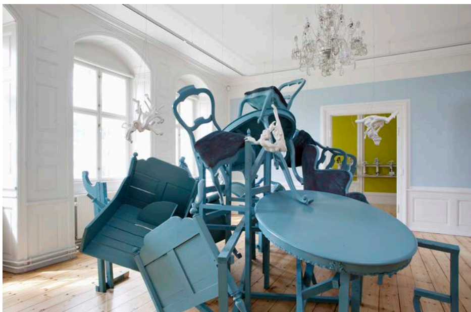
Louise Hindsgavls udstilling Power. Porcelæn. Poesi på Rønnebæksholm og Skovgaardmuseet blev støttet af Statens Kunstfonds Projektstøtteudvalg for Kunsthåndværk og Design i 2014.

er dermed sikret et solidt kendskab til dansk kunsthåndværk og design. Dermed er bredden sikret i udvælgelsesprocessen, og den åbenhed, som Crafts Collection tidligere sikrede for områdets mange interesser, tilgodeses nu gennem det løbende arbejde med evaluering af indkomne ansøgninger og tildeling af tilskud til mange forskellige udøvere.